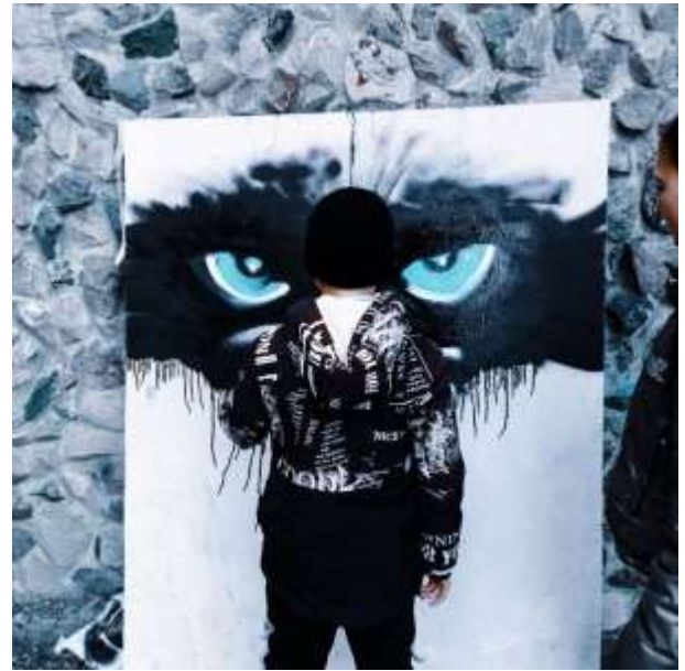
Галерея работ воспитанников: